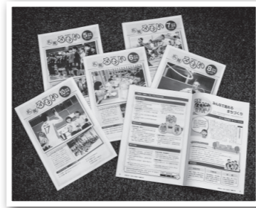
▲広報誌「広報るもい」

広報誌がお手元に届かない世帯の方は、市の施設または市内コンビニエンスストアへ足をお運びください。なお、店頭での設置は毎月10部と限りがあります。店頭がない場合は、市内の各公共施設に設置している広報誌をご利用ください。