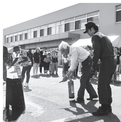
▲災害時に備えた市民防災訓練

答弁 平成31年3月29日に社会福祉法人萌寿会と「留萌市と萌寿会との福祉避難所の指定に関する協定」を締結し、留萌市で初めてとなる福祉避難所の指定を行った。今後も、要介護者の受け入れが可能な設備を有する社会福祉施設と協定締結を行い、市内の福祉避難所の指定拡大に努める。