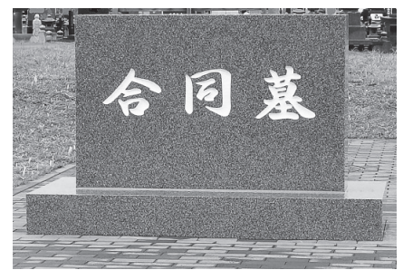
▲運用が始まっている合同墓

A 3月中には事前申し込みはなく、4月から運用し、38件、約90体が納められた。市内外でこれまで自宅などで保管していた遺骨を納められる方が多い。