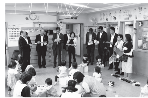
▲2歳児までの市立病院院内保育

市立病院では、病児保育室と院内保育所を見て回りました。病児保育とは、病中または病気の回復期にあるお子さんを就労などのため、家庭で保育できない保護者にかわり一時的に保育すること。今年2月に東雲診療所1階奥に保育室が開設されました。また、市立病院に勤務する医療従事者の子どもを他の保育施設に入所する前に2才児まで保育することが出来る院内保育所を見て回りました。さらに、5階の休床施設など病院内における施設の現場を実際に見