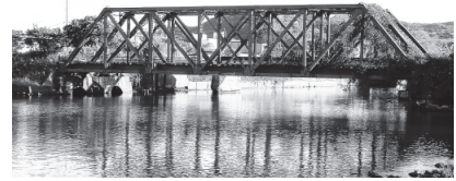
▲「旧留萌〜増毛間」JR線路跡地の活用は