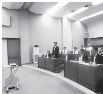
▲8月の芽室町議会視察風景

することによって議員と住民とが同じ情報を共有できるようにすることが課題として考えられます。 議会ICT導入に向けた議論は、平成29年10月に実施された行政視察から調査研究が始まりました。当委員会では今回の視察を機に、タブレット導入が、開かれた議会の実現に向けた「情報公開」と「市民参加」の機会を拡充するために必要であると結論付け、年度内の整備を望むものと致しました。 また、議会モニター制度については、引き続き調査研究する必要があります。