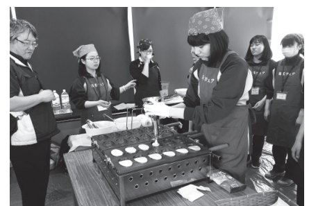
▲かずもちゃん焼きを販売する留萌高校の生徒