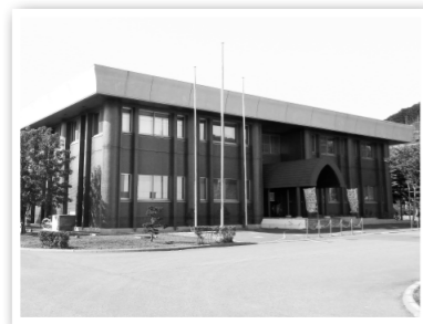
▲留萌浄化センター

▼留萌浄化センターでは、家庭や事業所などから出された汚水を浄化し、きれいな水にしています。