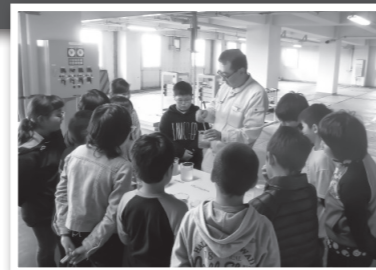
▲汚水処理の仕組みを学ぶ子どもたち