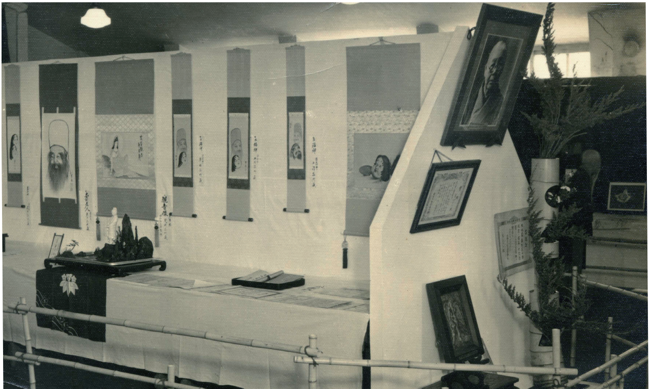
てんじ 展示の様子