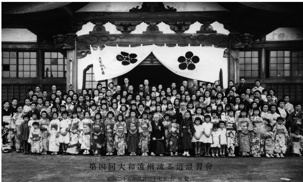
昭和25年(1950)第4回大和遠州流茶道温習會