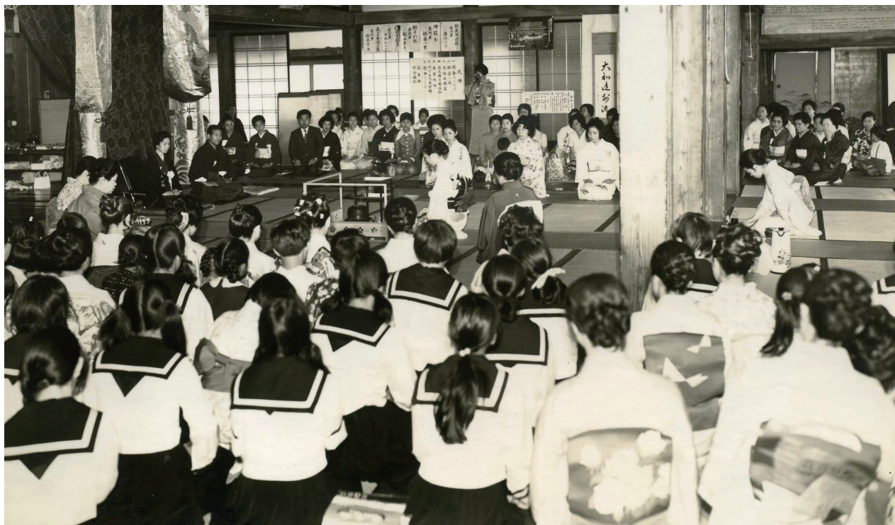
お寺での茶会 (正覚寺 しょうがくじ )