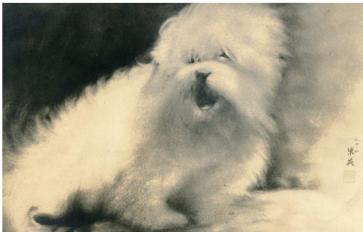
たでぬま しえい 蓼沼ナヲ (紫英) 筆 犬 (油絵)