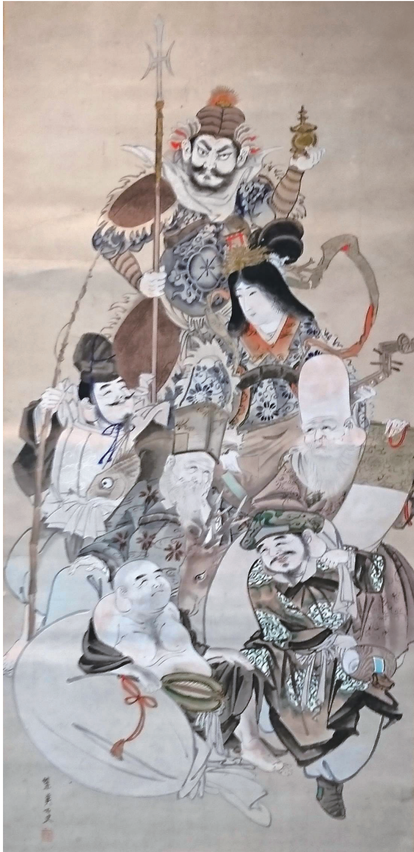
たでぬま しえい 蓼沼ナヲ (紫英) 筆 七福神の図