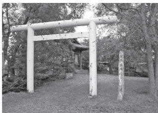
▲留萌市文化財に指定された「旧五十嵐億太郎邸跡地」

▼市・教育委員会では、留萌の歴史を語る上で重要な史跡である「旧五十嵐億太郎邸跡地(大町3丁目)」を留萌市文化財に指定しました(指定日:平成29年5月16日)。