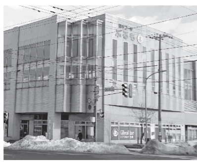
▲留萌市温水プール「ぶるも」

避難所の運営マニュアルを作成し、地域でも万が一の時のために共通理解を図る必要があると考えるがどうか。