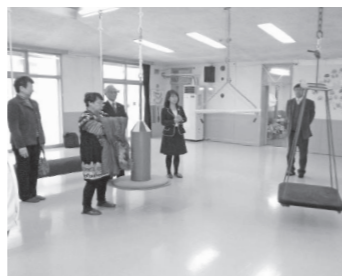
▲療育環境の整備が課題となる幼児療育通園センター

12月21日、幼児療育通園センターの視察に行き、施設全体の老朽化確認や課題となっている設備の改善等現状把握をし、今後の協議の参考としました。