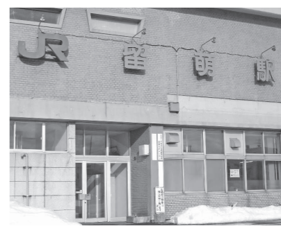
▲廃線が懸念されるJR留萌駅

向が見出せるのかと、全道市長会としても北海道全体の交通網のこと、国の支援のことで要望を出している。市民の声、議会での議論を聞き、判断していきたい。