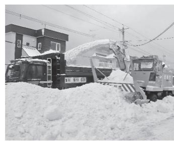
▲安心・安全な道路環境を確保する除排雪

市民雪捨場は昨年と同じく、「大和田8線左沢」「ゴールデンビーチるもい」の2カ所を開設し、利便性の向上を図ります。