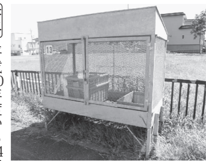
▲ごみステーション

問一 市政運営について 市立病院の平成29年度の医師確保の見通しや現状の経営状況について伺いたい。 平成29年10月に市制施行70年を迎える。記念事業を実施するにあたり、留萌市民歌や健康サンバの普及、市民、子ども意見やアイデアを生かした取り組みを求める。 答一 地方の医師不足という課題は改善の兆しが見られず、平成29年度も厳しい状況になると受け止めている。外来収益はほぼ想定通りであるが、入院収益は予定を下回っている。 28年度予定していた診療収益の確保は難しい。 70周年記念事業は、所管で計画する事業や既存事業とのタイアップなどで調整する。市民歌や健康サンバの普及は考えていない。市民が楽しめる事業内容を考えている。 問二 環境問題について 国は平成20年度に地球温暖化防止実行計画を策定したが、市の現状の対策や取り組みを知りたい。リサイクル率が低下している廃棄物の資源化として、留萌市独自の紙おむつ類のリサイクルの取り組みとして検討すべき。また、今後の高齢化の進展に伴い、ごみの分別、排出などを考えるべきではないか。 答二 平成20年度から24年度までは事務事業を対象に、18年度を基準として二酸化炭素を3%削減することを目標に取り組み、13・2%を削減した。 6月に環境パネル展、11月には留萌環境ネットワークと共催で「ecoアカデミア」を開いた。施設の延命化を図るため、ごみ処理先進地を参考に1市2町で、考えていく課題と捉えている。今後、町内会とも相談したい。