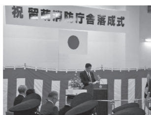
▲留萌消防庁舎落成式

留萌消防職員も新庁舎になり職場環境が改善されたが、当組合議会としても、更に消防力の充実強化の確立にもしっかり努めていきます。