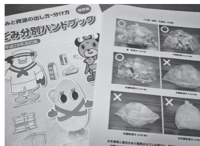
▲ごみ分別ハンドブックと一緒に配布されたポリ袋の比較表

答 注意事項の資料にポリ袋の厚さを記載したことと中身が見えないとする基準が収集地区によって一定でないことが市民に混乱を生じさせた。町内回覧や広報誌などで分かりやすく周知し、必要に応じて個人や町内会などを訪問して説明する。