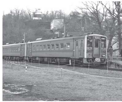
▲廃線となった留萌線(留萌―増毛間)

深川市長や沼田町長は自身の意見を表明したが、高橋市長はどのように考えているか伺いたい。沿線自治体との協議はいつごろ行う予定なのかお聞きしたい。