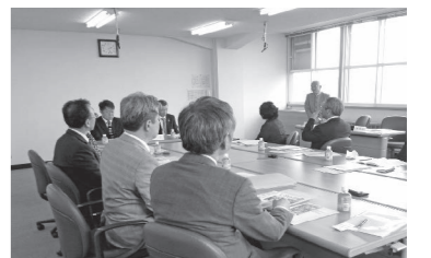
▲議会改革の取組について行政視察に訪れた千葉県君津市議会の皆さん(5月10日)

※視察の際は、留萌経済の活性化を促すため、市内での宿泊や食事を積極的にお願いしています。