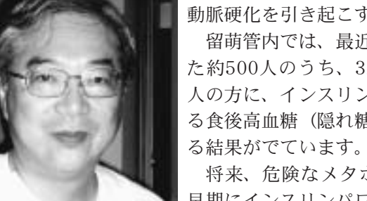
111 | | | | | | | | | |

メージを受けて詰まりやすくなって、動脈硬化を引き起こす原因になります。 留萌管内では、最近血液検査を受けた約500人のうち、32%にあたる160人の方に、インスリンパワー低下による食後高血糖(隠れ糖尿病)が疑われ