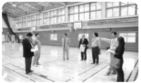
のた床を 一装で カピ 力

工事期間 平成22年5月24日~11月1日 工事内容 ○壁・天井の鉄骨ブレース設置 ○屋根鉄板の新設 ○外部窓を複層ガラスに取替 ○バスケットゴールの電動化 ○照明器具改修 ○遠赤外線暖房機の新設 ○便所の改修 など