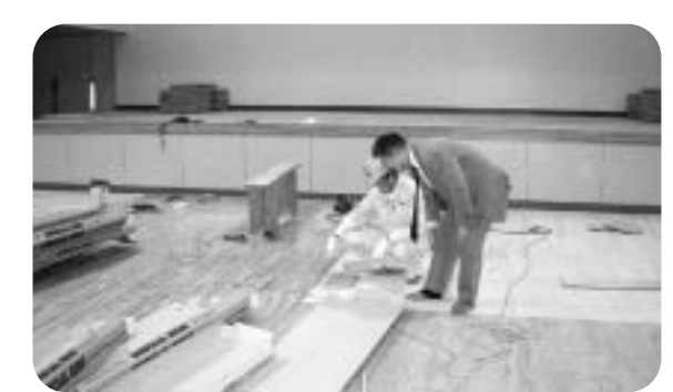
床下の (鋼製床) 耐震 性 ŧ 高

工事期間 平成22年5月24日~11月1日 工事内容 ○鉄筋コンクリート造耐震壁設置 〇壁・天井の鉄骨ブレース設置 〇外壁塗装 ○床フローリング新設 ○電動式バスケットゴール新設 〇スピーカー・放送器具の取替 〇照明器具改修 など