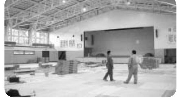
な器 で明 (.) 体