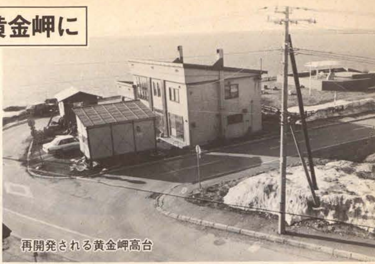
再開される黄金岬高台