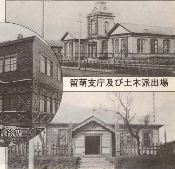
留萌支庁及び土木派出場