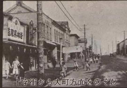
十字街から大町方面をのぞむ