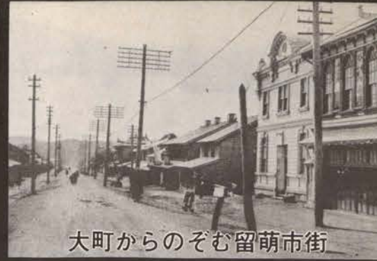
大町からのぞむ留萌市街