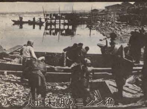
大正末期のニシン漁