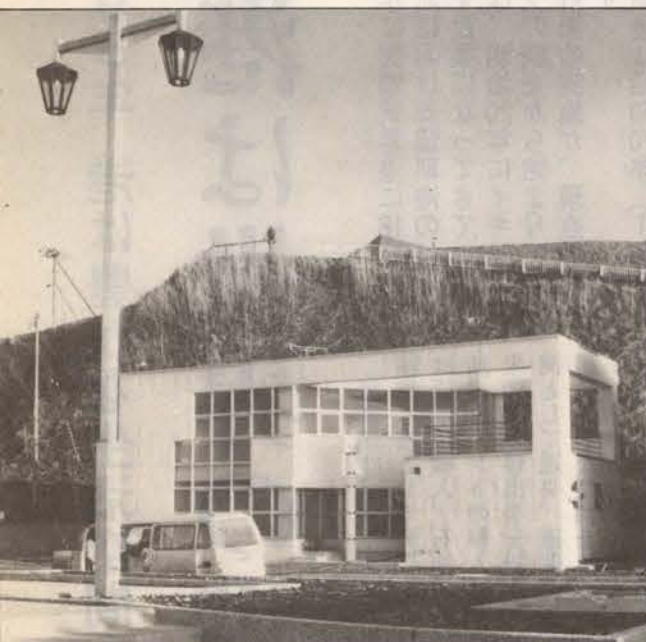
黄金岬海浜公園のオレンジハウス