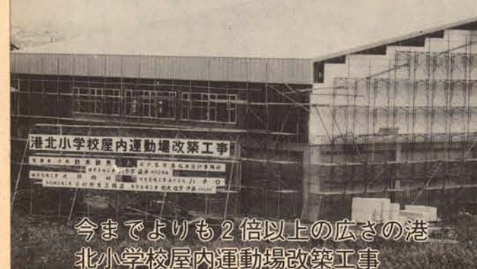
今までよりも2倍以上の広さの港北小学校屋内運動場改築工事

市内一のノッポビル 市内に数多くある公営住宅の中で、ショッピングセンターが建物の中にあるのは錦町公営住宅が初めて、1階はショッピングセンター、2階から10階までは、2LDK・3LDKとゆったりとした設計の公営住宅になっています。工事は、62年度完成めざし、工事を進めています。