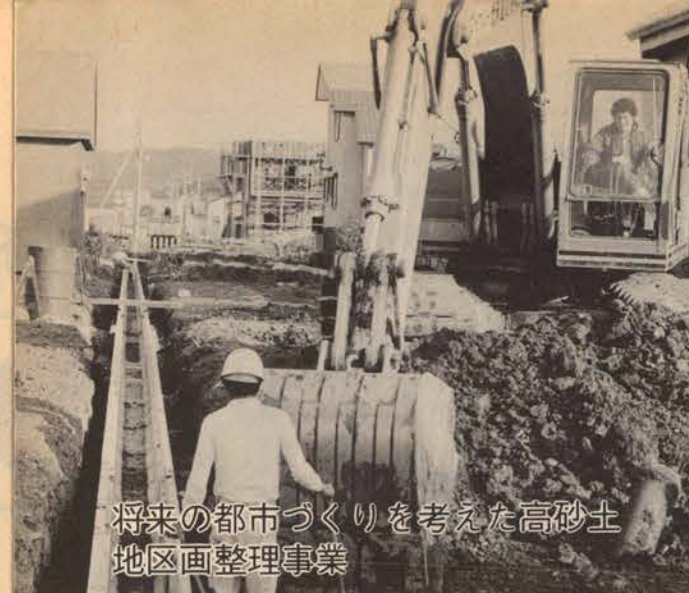
将来の都市づくりを考えた高砂土地区画整理事業

温かい・広い 港北小屋内運動場 留萌市では、老朽化した校舍等の施設整備を計画的に行なっていますが、61年度は、総工費1億6900万円ほどかけ港北小学校屋内体育館を11月完成めざし建設中です。今年の冬は、温かい、広い体育館で、スポーツができることでしょう。