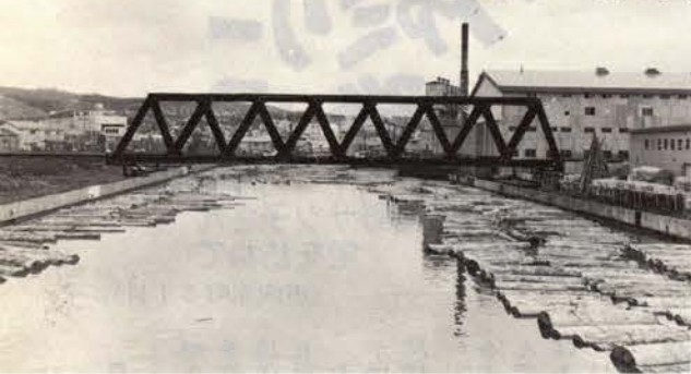
新しい副港橋の完成予想図

防災ダム建設工事として、現在道によって中幌ダムと樽真布ダムの建設工事が着々と進められています。 中幌ダムは、総事業費十六億八千万円を投入して、昭和四十六年から建設されているもので、これまでに約七十割の進捗状況となっています。 堤高二四〇、堤長二二〇、貯水量二百六十二万トンの大型防災ダムは、昭和五十六年度を完成目標に急ピッチで建設されています。 また、樽真布防災ダムも、昭和四十七年から総事業費二十六億円を投入して建設されているもので、三十割の進捗状況です。 規模は、堤高二四〇、堤長三三九で、貯水量は九十二万トとなっており、昭和五十九年度を完成目標としています。