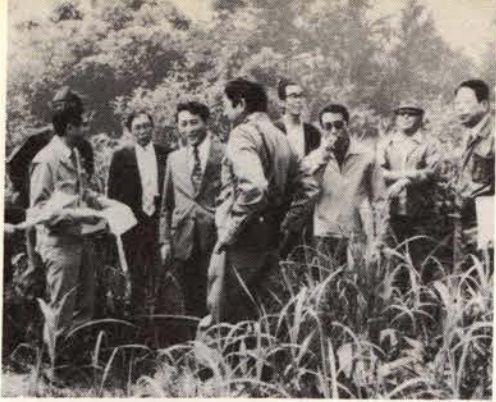
視察中の経済常任委員

市では、現在大和田町に建設中の福祉住宅と、十月一日から明年三月三十一日までに空く市営住宅入居者を、次の要領で募集します。空住住宅の場合は、この期間内に移転や転出で空いた公営住宅に、順番に入居できるもので、この候補者を募集するものです。 〔募集団地 五十年建設道営福祉住宅(大和田団地) 八戸(三LD)に六戸(二LDK二戸)〕 空住住宅は、大町、沖見、旭町など市内十三団地が対象です。 〔受け付け期間 八月二十一日から三十日まで(ただし、平日は午前九時から午後五時、土曜日は正午、日曜日は除きます。)] 〔受け付けとお問い合わせは 市役所建設部管理課(三階) 電話(2)一八〇一番 内線二五四番〕 〔1〕市内に住所または勤務先がある 〔2〕現に住宅に困窮していることが明らかであること。 〔3〕現に、同居したまたは同居しようとする親族(事実上婚姻関係と同様の事情にある者も含む)があること。 〔4〕連帯保証人二名を付することができる。 〔5〕市民税を滞納していないこと。