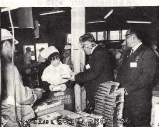
水筒加工機と、電気工場の設備を視察