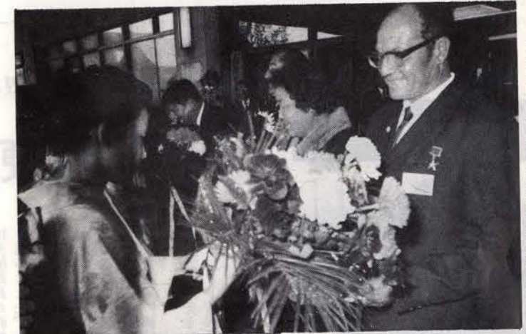
ようこそ……市職員から歓迎の花束を受ける