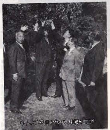
小学校の真盛りの壇上で