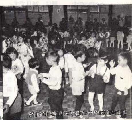
留萌保育所で母子供たちの遊戯の遊ば