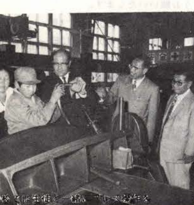
衛生機と、プラスチック製作