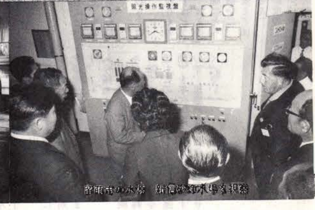
留萌市の水源 新信の浄水場を視察