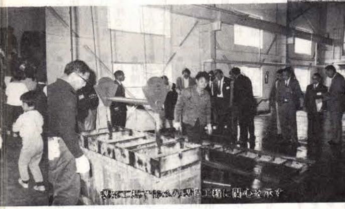
製糖工場製糖機の製造工程に関心を示す