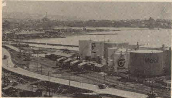
工業地域は留萌港を中心に