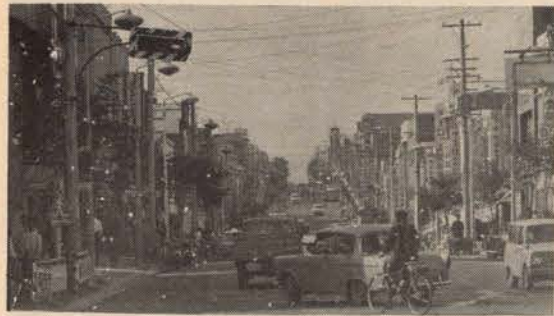
商業地域は、経済活動の中心地