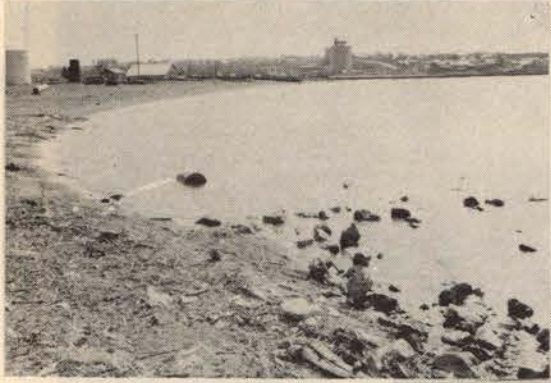
古丹浜貯木場は8万平方メートルを造成、臨海道路や陸上貯木場の造成が行なわれる(古丹浜貯木場地区)

道北随一の漁港基地を旨とする東岸船溜りは、44年から着手され、いよいよことしから掘込み作業にかかる。漁船専用船溜りの完成とともに、商港留萌として、道北随一の港湾整備は着々と進む。