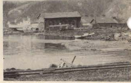
(東岸船溜りとなる船場町地区)

まず、開発建設部によって行なわれている南防波堤延長工事①は四六五メートル、北防波堤四四四メートルを延長②南防波堤に港湾施設用地一万三千平方メートル③四八〇〇平方メートル防波堤百二十メートル、古丹浜貯木場に北埠頭用地二万平方メートル④物揚場百二十メートル⑤を、また塩見臨海造成地に継