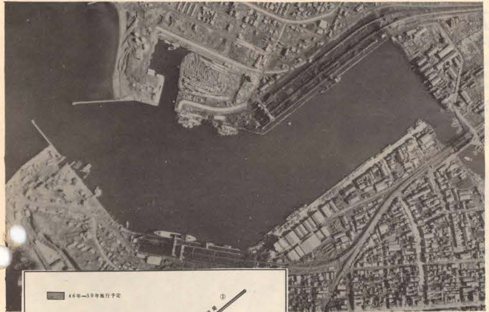
△空から見た現在の留萌港周辺

坂の多い留萌、千望台から港を見おろすと、グリーンと日本海に向かって力強く伸びる防波堤、円い輪が見える……あそこが石油基地……港のようすが、グングン変わっていることがわかります。