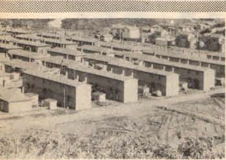
簡易保険融資で建設される春日団地