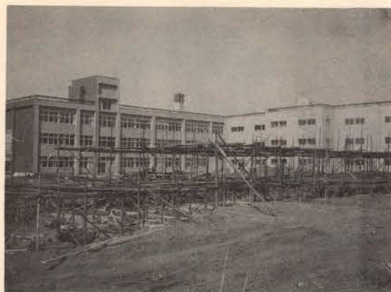
第3期工事が始まった留萌小学校

さる昭和四十三年から四十五年までの三カ年計画をもって進められてきた、市立留萌小学校改築工事は、いよいよ今年、その最終年度をむかえ、十月三十一日完成を目標に、工事がスタートした。 この校舎は、四十三年第一期工事が始まり、一四一六平方メートルを、四十四年第二期工事で二九九五平方メートルを完了し、今年第三期工事では、二三〇三平方メートルと渡り廊下などを含めた屋内体育館一二三平方メートルの建設が進められる。 第二期工事が終了してから旧校舎の火災など不慮の事故に見舞れたため、子供たちの勉強にも不便をかけてきたが、この校舎の全工事が完了すると、鉄筋コンクリート三階建て、総面積延べ八〇〇〇平方メートルで、総工費約二億六千五百万円（屋内体育館建設費を除いた額）で、普通教室四十、視聴覚教室二など、道内で三番目の大きさというマンモス校舎の完成で、子供たちも、伸びのびと勉強ができる状態に、もう少しというところだ。 校舎内の内訳を見ると、北側（日本清酒側）