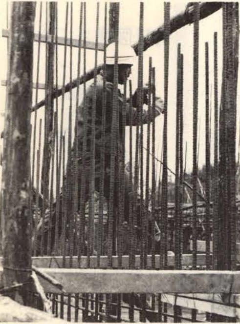
浄水施設工事は急ピッチに

計画規模 ○目標年次 昭和五十年 ○計画給水人口/四万七千人 第五期拡張工事の計画概要 浄水施設工事は急ピッチに このため、現在新信砂の水源 地にある「ろ過池」を廃止して、 浄水施設を建設中である。 また、水不足については、留前 札幌間の国道にそって布設さ れている送水管を、道交差地点 (信砂から留前)から沖見町配 水場までの十一キロ間に、管を 太くし、六百ミリ送水管の一本 化により落差を利用し、従来の 管より自然流水の圧力が強力に なり、水源池から沖見町配水場 まで、自然流水が流れます。 これにより、浜中町にある送水 加圧ポンプ場は廃止されること になります。 総工事費三億七千五百万円という 多額の工事費をかけて行われる第 五期工事によって、市民のみなき まに「満足いただける水を給水す ることができそうです。 しかし、この多額の工事費も、 水道事業は、独立企業ですので、 水道をご利用される使用料だけで まかなっていません。 使った水の代金を支払えばよい という考えだけではなく、お金の のかかった水は、もう「天からの もらい水」ではありません。 今や「水はつくりだされるもの 」へとかわってきたのです。 水を少しでも節水してくださる よう、ご協力をお願いします。