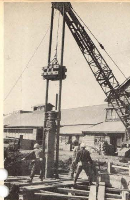
工事が急ピッチに進む

窓口を開設し、新築の場合の水道配管方など、水道に関する相談を受けますので、ご利用ください。