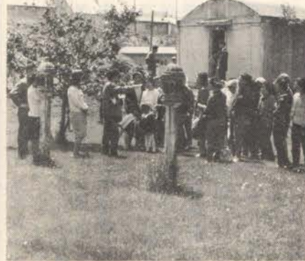
見学をする生活学校のお母さん

日常、私たちの生活から切りはなすことのできないのが水です。留萌市では、ことしも六月一日から始める全国水道週間にあわせて