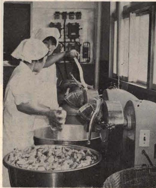
▲野菜きざみもすべて機械で行われる。