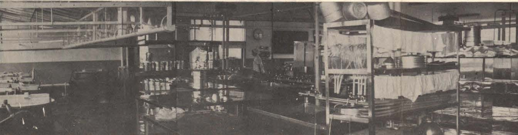
▲六千人の子供たちの食事をあずかるだけに清潔整頓はおこたない。