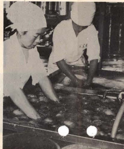
▲山と積まれた野菜もきれいに洗われて……