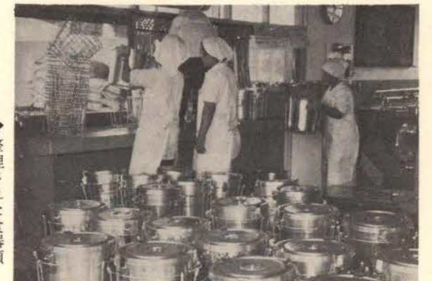
▲整理された食器類が朝早くから積み出される。