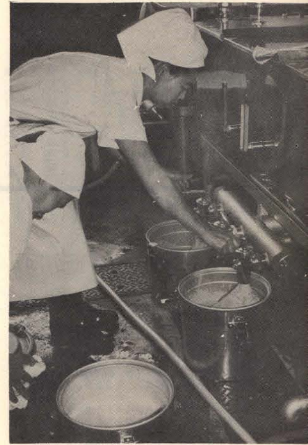
▲毎日午前7時から給食の準備がはじまる。