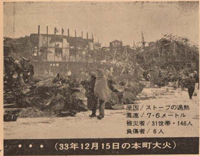
原因/ストーブの過熱 風速/7.6メートル 被災者/31世帯・146人 負傷者/6人