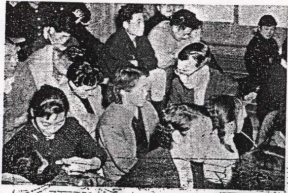
写真は農村における公聴会風景

市民のために行はれるべき市政は、市民の意見と協力を得て進められるべきものである。市民は市政の発展と向上に責任を負うべきであり、市民の声を市政に反映させるべきである。 市民組織は、市民の意見をまとめて市政に反映させるための重要な役割を果たす。市民組織を通じて、市民は市政の運営に意見を述べ、市政の発展に貢献することができる。 市民組織の目的は、市民の利益を守り、市政の発展を促進することである。市民組織は、市民の意見をまとめて市政に反映させるための重要な役割を果たす。