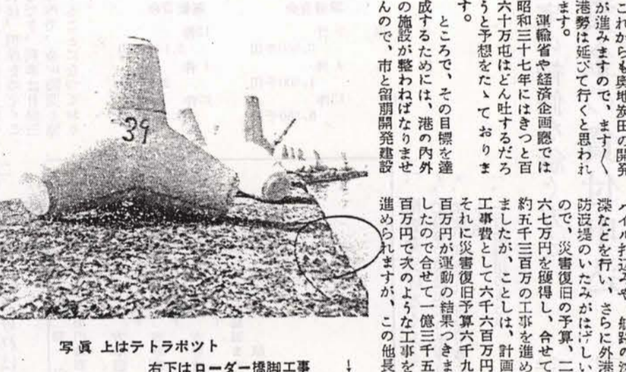
写真 上はテトラポット 右下はローダー橋脚工事

一昨年(昭和三十三年)遂に市民待望の百万トン吐(積揚)した留萌港は、昨年も百万トン消化しましたが、これは十年前の昭和二十四年四十三万トンに比べると約二倍半にもなり、これからは奥地農産物の開発が進みますので、ますます港勢は伸びて行くと思われ、港の整備の必要が感じられます。