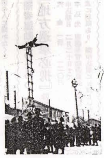
出初式における登梯