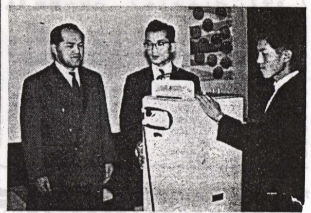
橋本市長から引當てた 電気洗濯機を受ける開發建設部職員

特賞を引當てた 開發建設部職員 納税奨励の三角クジは今 まで特賞や一等などの当り がなかつたが、特賞の電気 洗濯機を引當てた方が出ま した。 去る八日、留萌開發建設 部の小使さんが、職員百九 十一名の市民税第二期分を まとめた六万七千四百元を 役の窓口にもつて三角クジ 百九十一本を引いたところ この中に特賞電気洗濯機の ほか三等の正油、四等の煎 茶各一本を引き當てました この電気洗濯機は果して 職員百九十一名のどなたの 手におちるか一寸気になり ますね。