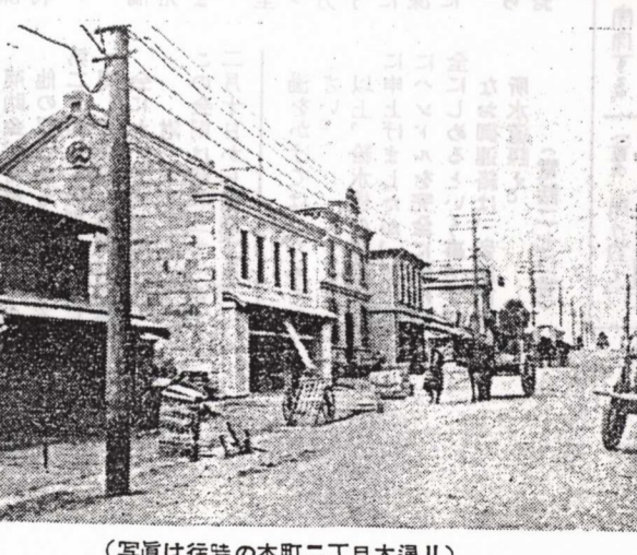
（写真は往時の本町二丁目大通り）

アイヌが死ぬと黒い着物で包みガマで縫つたキナ（ござのようなもの）で更にも巻く一本の紐に伸して何處へでも埋められたのであるから雨など多かひ出される屍なども多かつたようである。幸甚は丸い四尺から五尺の棒でマキリでこれを削ります。このときは下から上へと巻くように削りかんなくつづの長いようなものを作り、これを切り放さず上方に付けて置きます。この棒を墓場に立てるの く、自分の会いたい人の居らぬ時は歸るまで一日でも待つていと云う風でした。時に雪の上に乗つて待つと云う事もありました。その人が来るその喜びは何とも云えません。その間誰か何と云つても何を聞いても黙つています。しんぼう強いには驚く外ありません。アイヌはこれぞ強いです。マキリで削りかんなくつづの長いようなものを作り、これを切り放さず上方に付けて置きます。この棒を墓場に立てるの