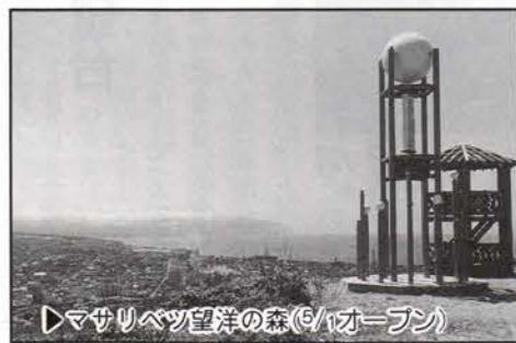
▶マサリベツ望洋の森(6/1オープン)