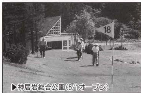
▶神居岩総合公園(5/1オープン)