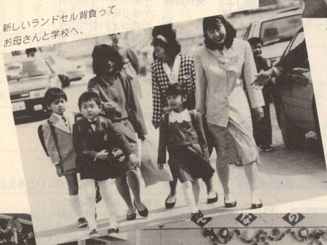
担任の先生はおんなの先生、 やさしい先生かな？