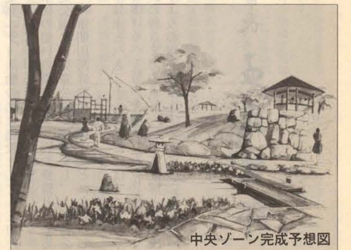
中央ゾーン完成予想図