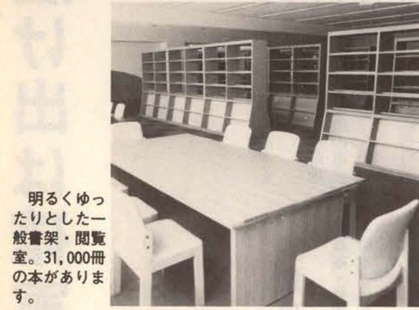
明るくゆったりとした一般書架・閲覧室。31,000冊の本があります。