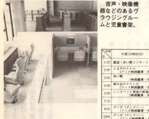
音声・映像機器などのあるヴラウジングルームと児童書架。