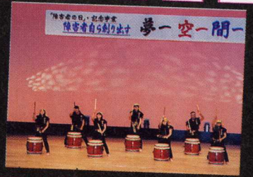
↑スタッフは、念入りに機器の設置、打ち合わせをしています。 ↑司会者と手話サークルの方。 ↑幌延北星園の皆さん。