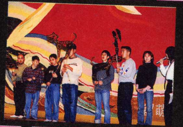
↑おにしが厚生園「シルエットサークル」による影絵「ちびくろサンボ」です。