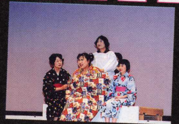
↑かもめ共同作業所・留萌ふれあいの家のみなさんによる、笑いあり、涙ありの劇「おキン・マイ・ラブ～子宝編」

一生懸命練習した成果を披露できました。 参加者、観客、ボランティアスタッフの方々が一体になって、 この第2回「夢空間」を成功させることができました。 感動がいっぱいのステージでした。