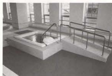
▲アクアトレーナー。足のリハビリに利用できます。