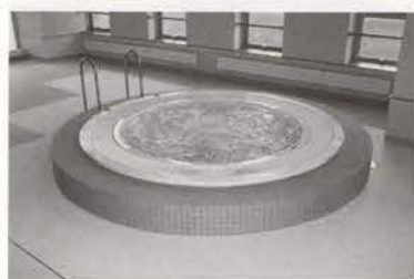
▲ジャグジー。泳いだあとや休憩時に体の疲れをほぐします。