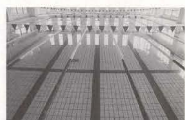
▲一般プール。全7コースで日本水泳連盟公認短水路です。

モー まさに、元気になるプールって感じだね。 長野 そのほか、身障者の方が安心してプールへ入れるように専用リフトも備え付けてあるんだよ。 ブル すばらしいわ。 おぼるも は、本当にだれもが利用できる施設なのね。 長野 つぎに、右手にあるのが子供用プール(長さ15m×幅5m×深さ0.5～1.2m)。このプールは、床を上下に動かして水の深さをコント