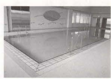
▲子供用プール。可動床で水深を調整。幼児から小学生低学年が対象です。