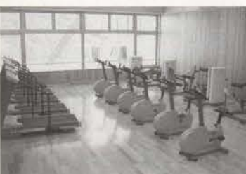
▲トレーニングルーム。広さはたたみ30畳分。筋力トレーニングができる。