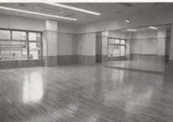
▲スタジオ。広さはたたみ38畳分。エアロビクスなど、各種教室を開催。