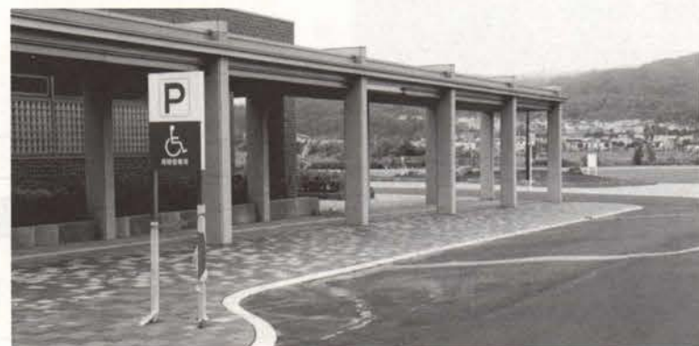
▲身障者も安心の乗降所

マコト 新病院は、土地の購入や施設建設に97億円、医療機器の購入などに22億円で、合計約120億円かかったんだ。でも、そのうち約112億円は借金(地方債)で、2031年までの長期ローンで返済するんだって。