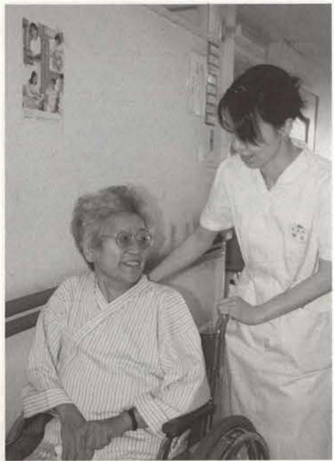
▲患者さんと看護婦が楽しそうにお話をしています。新病院でも安心して入院できます。