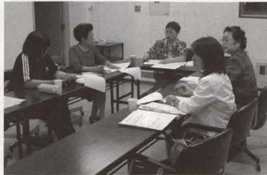
『女性ネットワーク・るる』実行委員会にて

「女性ネットワーク・るる」への参加団体等を募集します ◆募集対象者 市内に在住する女性(個人)・女性団体、サークル ◆募集期間 8月1日(火曜日)から31日(木曜日)まで ◆申し込み方法 女性ネットワークに参加していただけの方は、申し込み書またはFAXにてお申し込みください。 (募集案内や申し込み書が置いてあるところ) 留萌市中央公民館・東部地