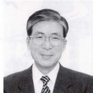
Norihiko Naganuma 市長 長沼憲彦