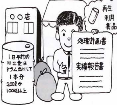
事業系廃棄物減量及び処理計画書