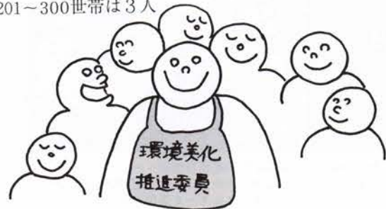
町内会ごとに環境美化推進委員を委嘱