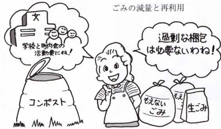
ごみの減量と再利用