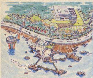
海のふもとと黄金岬エリア