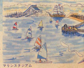
マリンスタジアム

水と光をテーマにしたシンボル広場を核に、海浜散策路や人工島、海の遊園地など、楽しみがもてる海水浴エリアを創出します。